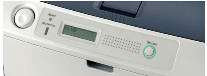
Painel do Modelo B410D/B410DN

Capacidade de Toner: Todos os modelos (B410D/B410DN/B430DN): 3.500 páginas B430DN: 3.500 / 7.000 / 12.000 páginas