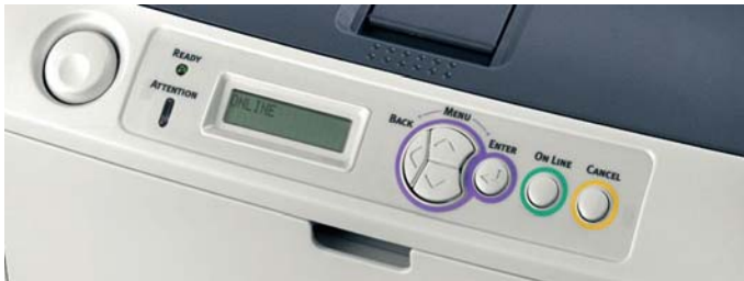
Painel do Modelo B430DN